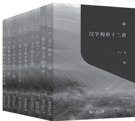
图13 商务印书馆推出“教育援青”人文学科建设基本用书系列（2022）

我国“两弹一星”的诞生地，青海同时也是多民族人民共同生活、和谐发展的美丽家园。为了巩固西部地区脱贫攻坚成果，铸牢中华民族共同体意识，近年来国家持续推进“教育援青”战略，加强中国特色社会主义高等教育体系建设，将多民族共同发展的高等教育事业放在了发展青海文化软实力的重要位置。在这项战略中，北京师范大学作为中国高等师范教育最高学府，与青海师范大学携手，共同承担起开设跨文化中国学课程和编写人文学科基础建设用书的重任，脚踏实地为东西部地区对口支援、资源共享、合作共赢打开了新局面，做出了新贡献。跨文化的知识交流是商务印书馆始终秉持的出版理念。自1897年开馆之初，商务印书馆就着意译介西学、编纂课本，在新旧交替的大变局时代沟通中西，引进世界先进的人文社科和自然科学知识。在人文社科领域有着丰富而悠久的出版经验积累，商务印书馆非常有幸能够与北京师范大学、青海师范大学合作，成为这次“教育援青”人文学科基础建设系列的出版单位。董晓萍、李国英两位老师领衔主编、由乐黛云、王宁、程正民等人组建编辑委员会的这套书，涉及人文学科最基础也最重要的领域，这一系列图书的编辑出版，对于商务印书馆而言，既是挑战也是锻炼。回顾历史，中华文明正是在不同民族之间不断交流、融合、碰撞中逐渐成长起来的。在新时代，习近平总书记反复强调：“铸牢中华民族共同体意识，就是要引导各族人民牢固树立休戚与共、荣辱与共、生死与共、命运与共的共同体理念。”要全面推进中华民族共有精神家园建设，就要加强现代文明教育和思想文化交流，使各民族人心归聚、精神相