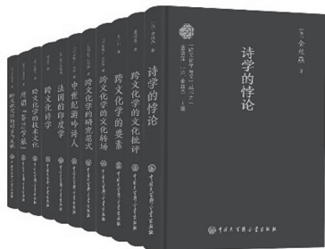
图15 董晓萍、〔法〕金丝燕主编“跨文化学导论”丛书，中国大百科全书出版社，2022。