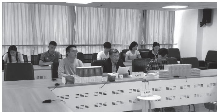
图12 2022年7月2日“教育援青”新书发布会暨跨文化中国学与铸牢中华民族共同体意识研讨会青海师大分会场

动。青海师范大学地处祖国青藏高原战略要地，是党和政府在世界屋脊上建立的第一所综合性大学。这里是祖国古老丝绸之路和新兴“一带一路”的腹地，高原生物多样性、多民族和谐聚居的人文传统，以及南亚和中亚多个国家历史以来友好交往和民心相同的历史经验，都是宝贵的高原财富。“教育援青”新书发布会暨跨文化中国学与中华民族共同体意识研讨会的召开，正是这种标志性成果。在加强人文学科建设同时，青海师范大学领导班子同时抓紧理工工科的综合建设、交叉学科建设和创新成果建设，我们近期获得10个国家级和省部级的一流学科建设支持，在国内高校的排名也大幅递进。通过这类学术活动和教育活动，我们将青藏高原的生态文化建设、中华民族凝聚力建设和一带一路国际化建设的扎实成果，在青海大地扎根，也在人类命运共同体建设中贡献青海人的一分力量。