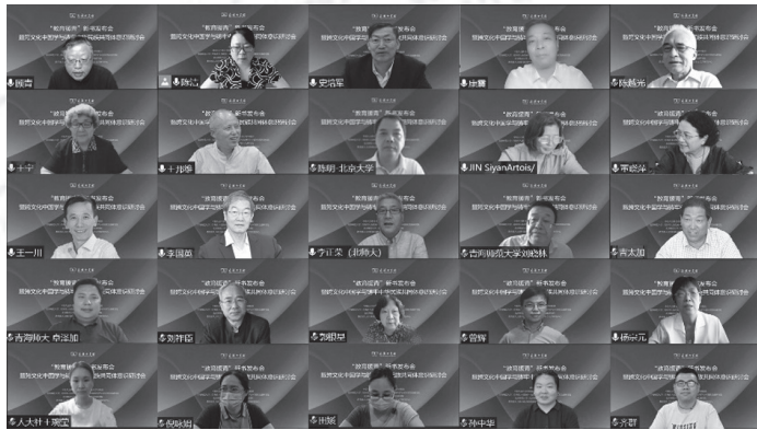
图 11 2022 年 7 月 2 日“教育援青”新书发布会暨跨文化中国学与铸牢中华民族共同体意识研讨会截屏（局部）

近年国家推进“教育援青”战略，高度重视我国各民族共同发展的高等教育事业，北京师范大学是我国高等师范教育的最高学府，承担西部对口支援位于青藏高原的青海师范大学任务，落实国家十四五规划，共建青海省人民政府-北京师范大学高原科学与可持续发展研究院和北京师范大学跨文化研究院“跨文化丝路研究”的重大项目，推进跨文化中国学，加强中华民族共同体意识建设。出版了“教育援青”与跨文化中国学、《大唐西域记》研究与多元文化交流、《跨文化研究的理论与方法》与人文学科前沿研究系列著作，并将这批成果投入“跨文化中国学方法论”研究生课程教学，在青海师大人文学科研究生中引起强烈反响。